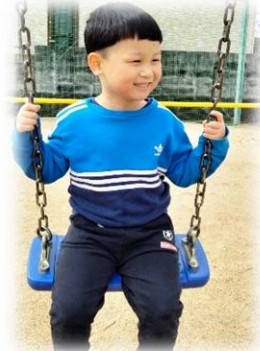
児童発達支援センターめやすばこ