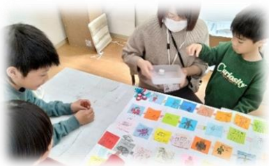
めやすばこきっずぷらす