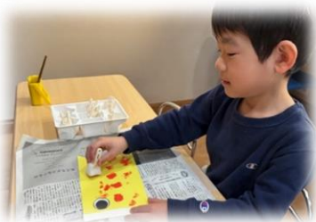
めやすばこ・りんぐ

少し早めのこいのぼり制作をしました🚩 色々な色でカラフルなこいのぼりが 完成しました！