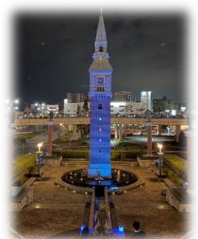
支援サポートセンター めやすばこ・リーチ