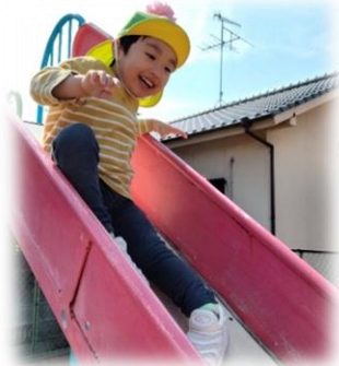
めやすばこ・きっずII