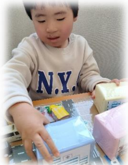
めやすばこ・きっず