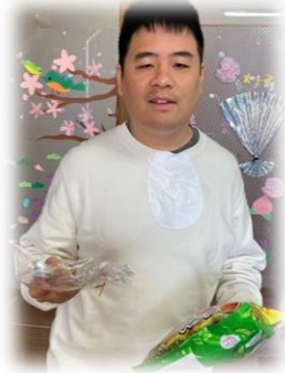
ブルー.キャンパス

おつかれさま会を行いました！大好きなお菓子や写真立ての記念品を貰ってニコニコ♪素敵な笑顔が見られました😊今年も一年間お疲れ様でした！