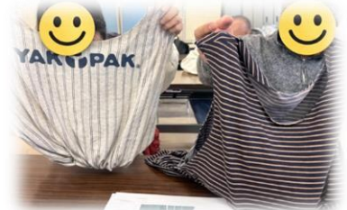
倉敷生活自立相談支援センター

センターでTシャツをリメイクしてエコバック作りを行いました。皆さん黙々と取り組まれ素敵なエコバックが完成しました🎵