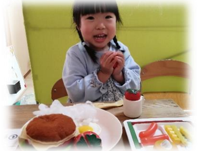
めやすばこ ひ・よ・り きっず