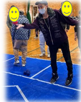
倉敷西部地域生活支援センター