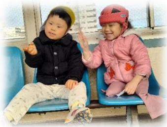
児童発達支援センターさんぽるて