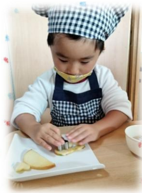
めやすばこ ひ・よ・り きっず

新聞遊びをしました!! ビリビリ と破れる音やひらひら落ちてくる 新聞を見て楽しみました😊