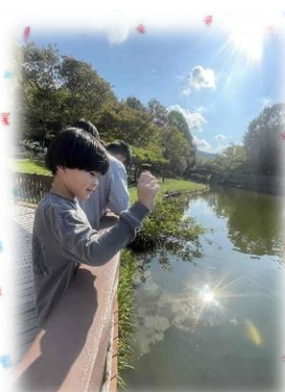
めやすばこ・ぶるーむ