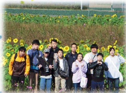
ワークスめやす箱