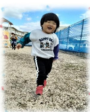
児童発達支援センターめやすばこ