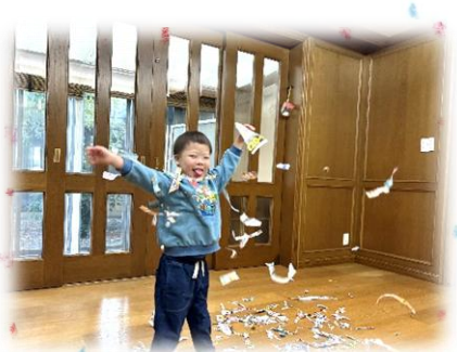
めやすばこ・りんぐ

新聞遊びをしました!! ビリビリ と破れる音やひらひら落ちてくる 新聞を見て楽しみました😊