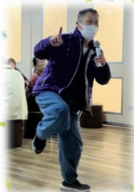
就労センターかなで

“みのり”との事業所間交流で、 べんがら染め体験をしました😊世界で 1つだけの布巾が出来上がりました💎