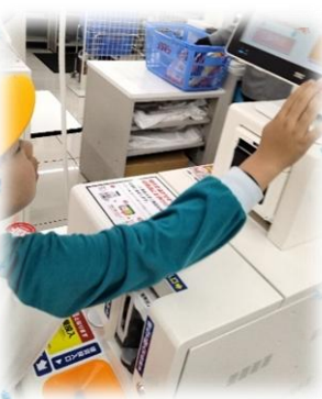
めやすばこ・きっずⅡ