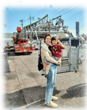
めやすばこ・きっず