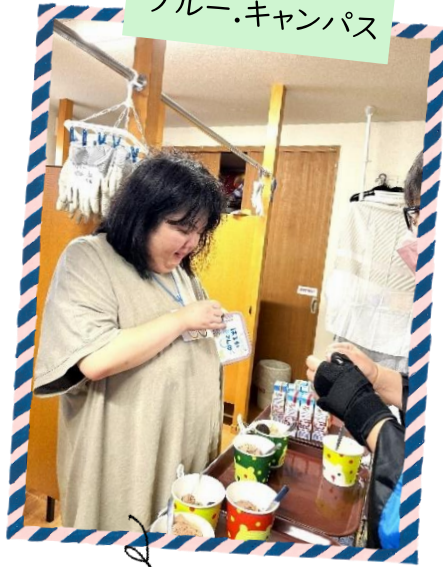
楽しみにしていた夏祭り♪ 「アイス」つください!