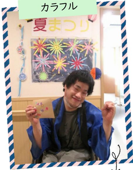
射的・かき氷・くじ引きと今回も盛り沢山の夏祭りでした☆彡