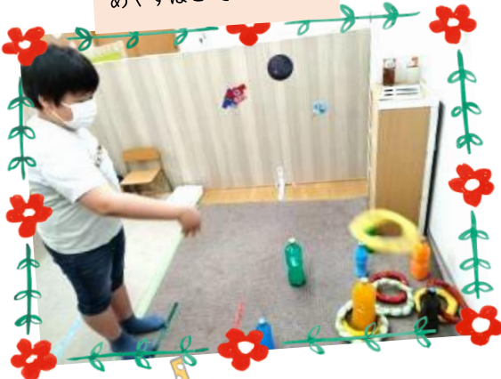
わなげをしました♪ ねらいをさだめて…それっ!