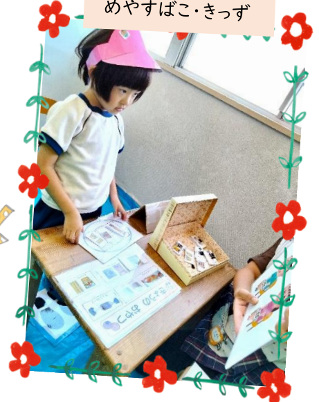
好きなものを選んで嬉しい♪ 3つ選んだら席に戻ります!