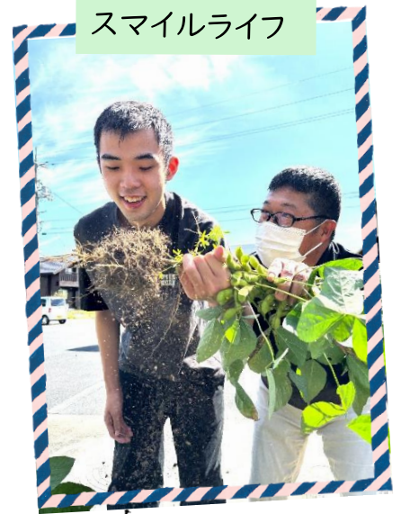
今年も枝豆が豊作!! 大地の恵みに感謝!!