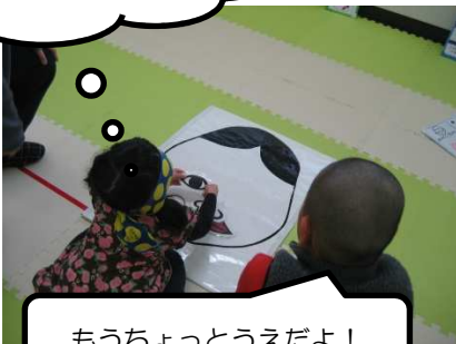
もうちょっとうえだよ！