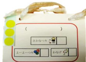
カード(文字とイラスト)