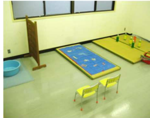
(ヨーヨー・魚釣り、輪投げ) 各コーナー