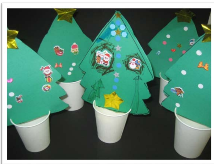
クリスマスツリー