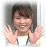
おかざきせんせい