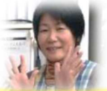
まつかみせんせい