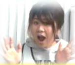
てらしませんせい