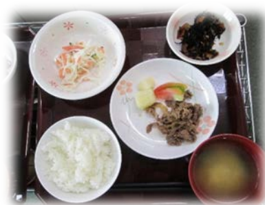
6 月 25 日（水）のメニュー

現在カラフルでは、ご利用者様に栄養のバランスが整った温かくて美味しい食事を提供することが出来るようになりました。ご利用者様からは「美味しい」「お汁があるのがうれしい」等、変更にあたって喜びの声をたくさん聞くことが出来ております。また完食される方が増えている事もあり、職員としても嬉しく感じています。